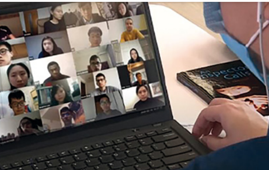
Arriba y por encima: Un instructor imparte una clase interactiva en línea en tiempo real

formulario de retroalimentación en línea de un sólo clic para que los estudiantes expresaran anónimamente sus opiniones o informaran sobre problemas técnicos.